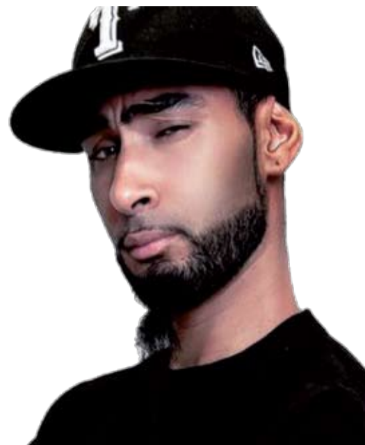
LAOUNI MOUHID (LA FOUINE), RAPPEUR & PRODUCTEUR DE MUSIQUE FRANÇAIS

concert, La Fouine a chanté plusieurs chansons de ses trois albums