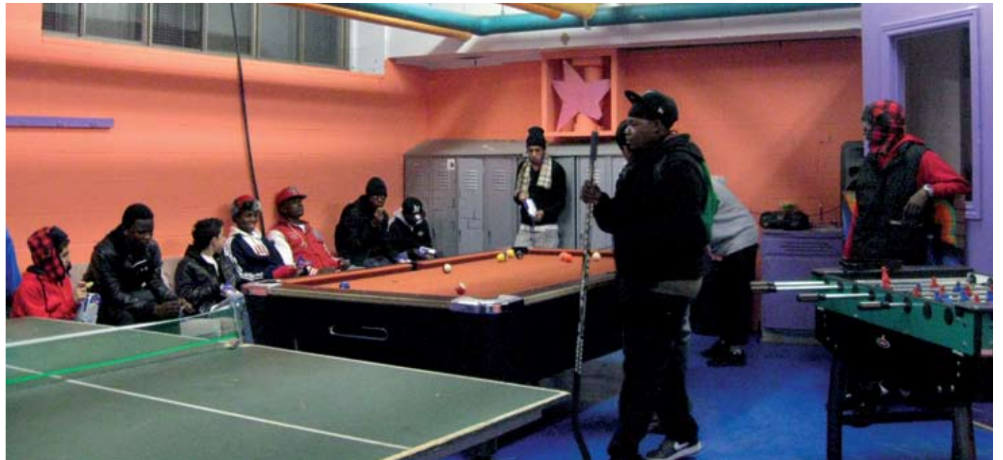
LES NOUVEAUX LOCAUX DE JEUNESSE 2000

QUELS SONT LES AUTRES SERVICES QUE LA MAISON DES JEUNES COMPTERA OFFRIR?