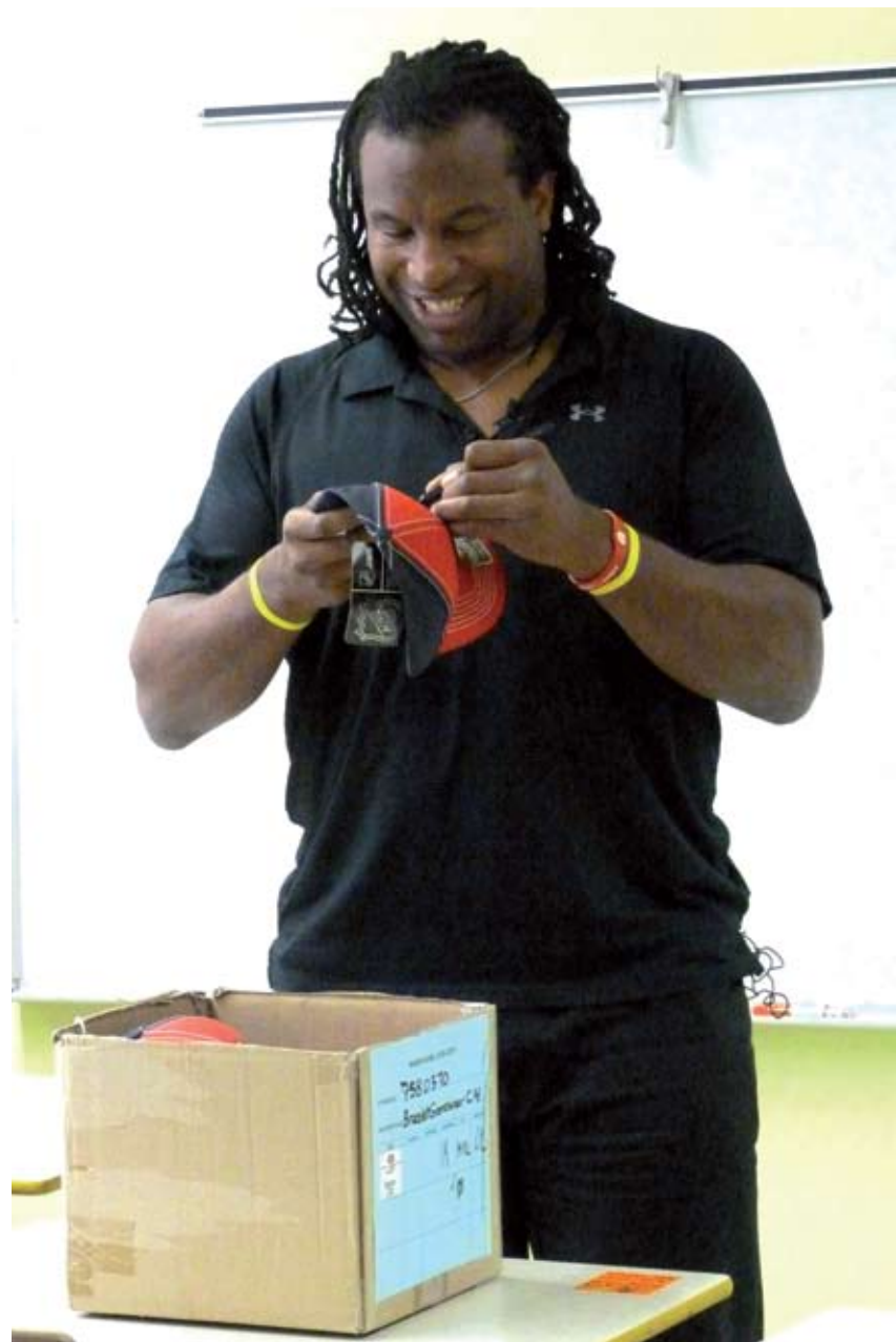
GEORGES LARAQUE SIGNANT DES AUTOGRAPHES

GL : Selon moi, la meilleure solution pour contrer le racisme, c'est l'éducation. Si un parent empêche son enfant de rencontrer des enfants d'autres cultures que la sienne, cela peut créer du racisme parce que l'enfant qui ne connaît pas les autres cultures est plus susceptible d'avoir des préjugés. Cependant, si les parents sont ouverts d'esprit et qu'ils laissent leurs enfants rencontrer des enfants d'une autre culture que la leur, pour lui, le